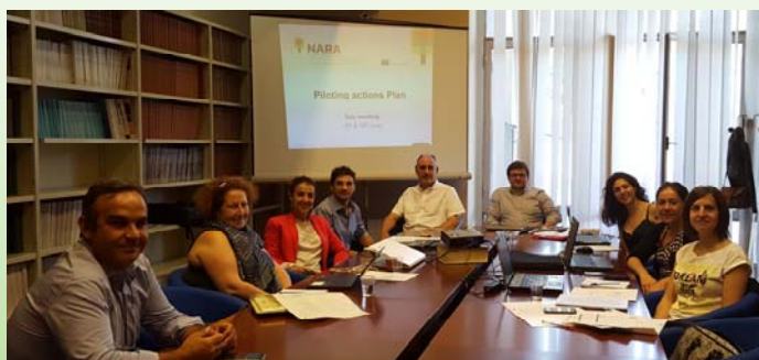
Συνάντηση του NARA στην Κατάνια Ιούνιος 2016

Κατά τη συνάντηση αυτή, συζητήθηκαν οι δραστηριότητες που έχουν ήδη πραγματοποιηθεί από την κοινοπραξία, αυτές που βρίσκονται σε εξέλιξη και αυτές που εκκρεμούν. Ο κύριος στόχος